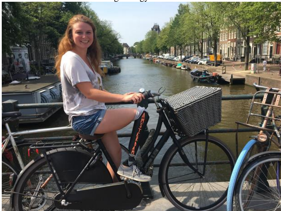
A múltbú lány az amszterdami csatorna felett biciklizett

Számos városban megfordult, múltába pedig főszereplővé vált, arra írja fel, éppen merre járt: kerékpározott az amszterdami csatorna fölött, Barcelonában egy városra néző falon pihent, Münchenben sörözött, az athéni Parthenón tövében napozott, de még Budapesten, a Parlamenttel szemben is csináltatott magáról egy fotót.