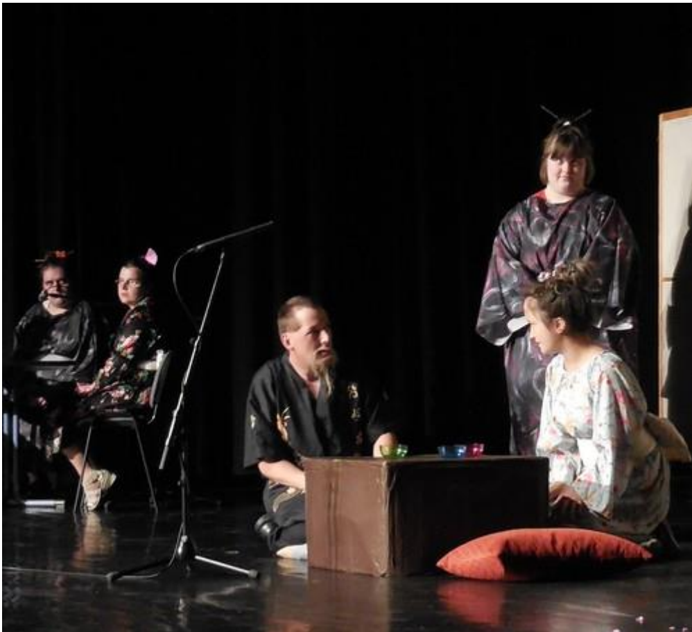
A japán öltözék segítette a szereplőket az azonosulásban. Nagy sikert arattak