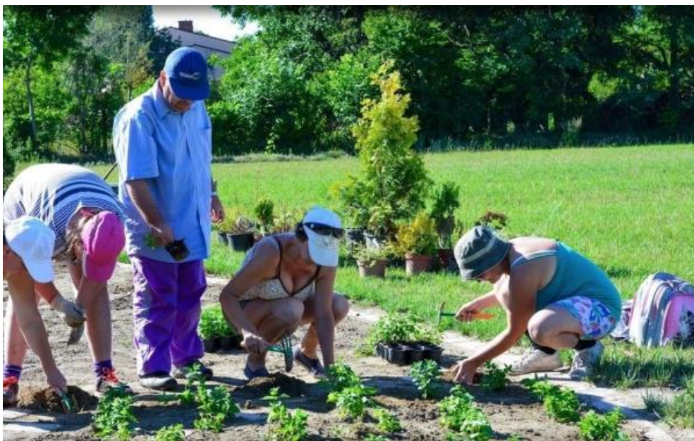
A gyógynövény-palántázástól egészen a szedésig ismerkednek a munkákkal a Naposház ellátottjai az ökoparkban.

– Tavaly szerveztünk elsőként „FOGY-asztható" címmel a Pisztráng Kör Egyesülettel közösen egy egyhetes munkára felkészítő tábort. Ennek sikerén felbuzdulva indítottunk egy gyakorlóprogramot, melyet a mosonmagyaróvári és dunaszigeti önkormányzat mellett civil szervezetek is támogattak. Hat fogyatékos fiatal választottunk ki a tábor tapasztalatait összegezve. Végül öten vállalták, hogy októbertől minden második szombaton reggel nyolctól délig, majd a tél után február végétől ismét kijárjanak Dunaszigetre különféle mezőgazdasági munkákra. Jogszályváltozás miatt ellátottjainkat már intézményen kívül is lehet foglalkoztatni, így hármukat alkalmazta májustól a Pisztráng Kör Egyesület. Egyikük egyébként önállóan is vállal már munkát – tette hozzá a szakember.