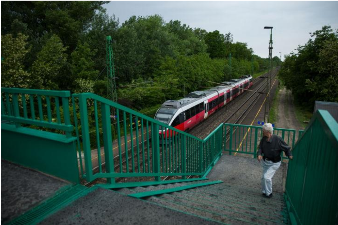
A Budapest irányába induló vonathoz siet egy utas az abdai megállóhelyen

A mozgásukban bármilyen módon korlátozottaknak azonban nincs könnyű dolguk, ha Hegyeshalom irányából Budapest felé utazva Abda megállóhelyen szeretnének le- vagy felszállni. A településen kialakított vasúti megállóhelyen ugyanis gyalogos felüljáró, más néven repülőhíd vezet arra a peronra, ahonnan a Hegyeshalom felől Győr, aztán Budapest felé közlekedő vonatok indulnak. Más lehetőség nincs az odajutásra.