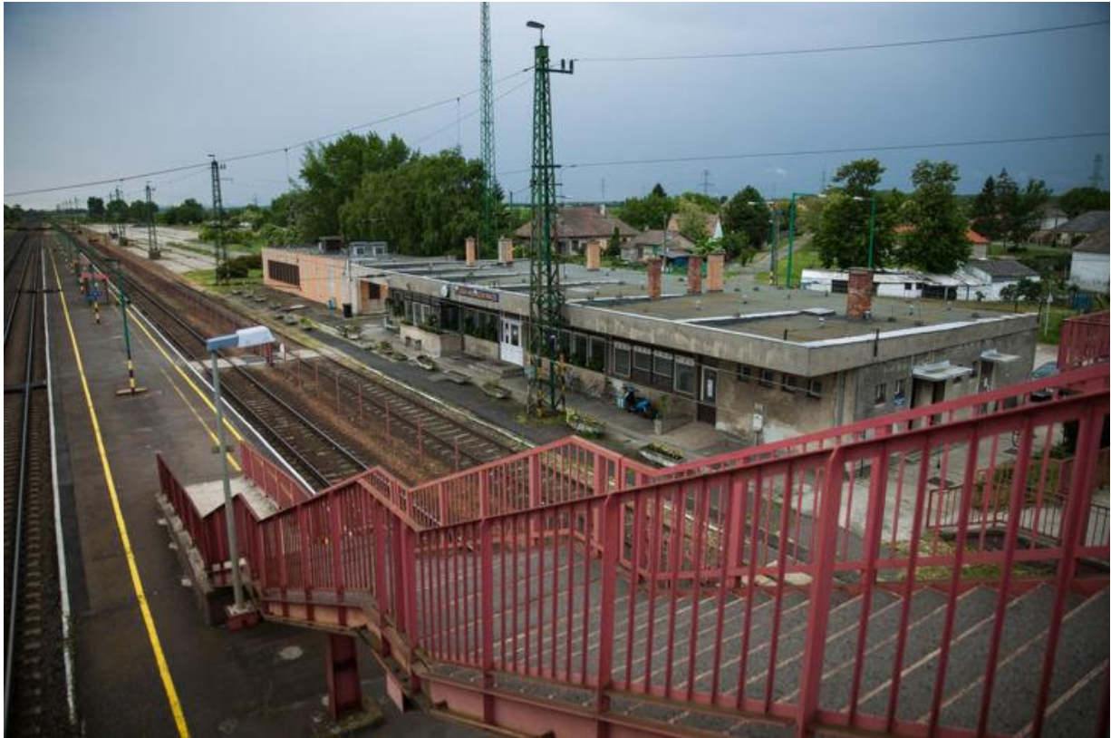
A lébényi állomás

Ha valaki ezen az állomáson szeretné az egyébként teljesen akadálymentes vonatokat mozgássérültként használni, annak azonban van megoldás: a vágányokat elválasztó kerítésen két ponton van egy-egy kapu, hogy a forgalomirányító személyzet könnyedén mozoghasson a sínek között. Az egyik ilyen átjárónál ráadásul a vágányok között megszüntették a szintkülönbséget, így a kerekesszékekkel is járható.