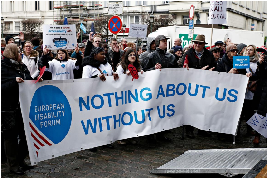
Tüntetés az Accessibility Act kapcsán 2017 áprilisában az Európai Parlament előtt

A törvényjavaslatot a fogyatékos embereket képviselő civil szektor kezdeményezte, és a fogyatékos emberek európai mozgalmának fő projektje volt évek óta. A javaslatot az Európai Bizottság támogatta ugyan, ám szinte teljesen kiherélte a fogyatékos emberekkel általában barátságosabb viszonyt ápoló Európai Parlament belső piacokért felelős szakbizottsága. A közlekedési és elektronikai vállalatokon, műsorszolgáltatókon túl az olyan, magukat emberarcúnak mutató vállalatok voltak a javaslat legádázabb ellenségei, mint a Google, az Apple és a Microsoft. Az érvek ismerősek: túlszabályozni a piacot veszélyes, mert rontja a versenyképességet, ráadásul költséges, sőt az innovációt is veszélyezteti. Igen: az akadálymentes (szakszóval: egyetemes ) tervezés mint a technológiai fejlődés akadály a dollármilliárdos profittal rendelkező vállalatok számára. Arépitő Védhetetlen álláspont , amelyet azonban EU-s politikusok is támogattak néhány hete .