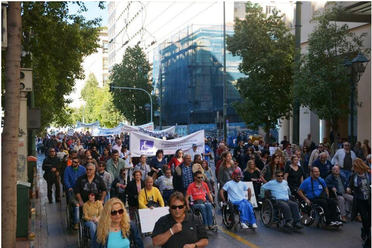
Görög fogyatékos emberek tüntetése a 2015-ös válság idején

Kár lenne azonban az EU hatását a fogyatékos emberekre csak a jogszabályok és a pénzek mentén nézni. A szimbolikus jellegű emberi jogi és szociális/esélyegyenlősítő uniós politikákat ugyanis azoknál sokkal erősebb, államadósságra és egyéb költségvetési mutatókra vonatkozó, valamint piacvédelmet kizáró politikák kísérik, amelyek a félperifériás kelet-európai országok felzárkózásának lehetőségét korlátozva, több szempontból is megnehezítik a fogyatékos emberek és családtagjaik életét, így például munkaerőpiaci érvényesülésüket is.