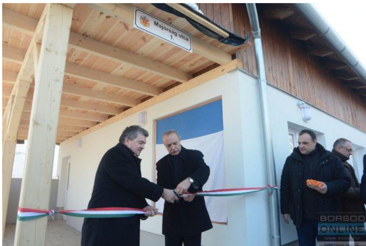
Az avatási ünnepségen - © Fotó: Kozma István

Miskolc – Újabb bentlakásos házat adtak át a Baráthegyi Majorságban autista fiatalok részére.