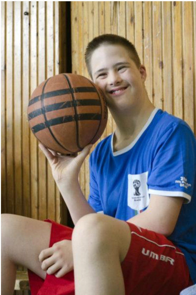
Marci hetente kétszer jár kosárlabda edzésre