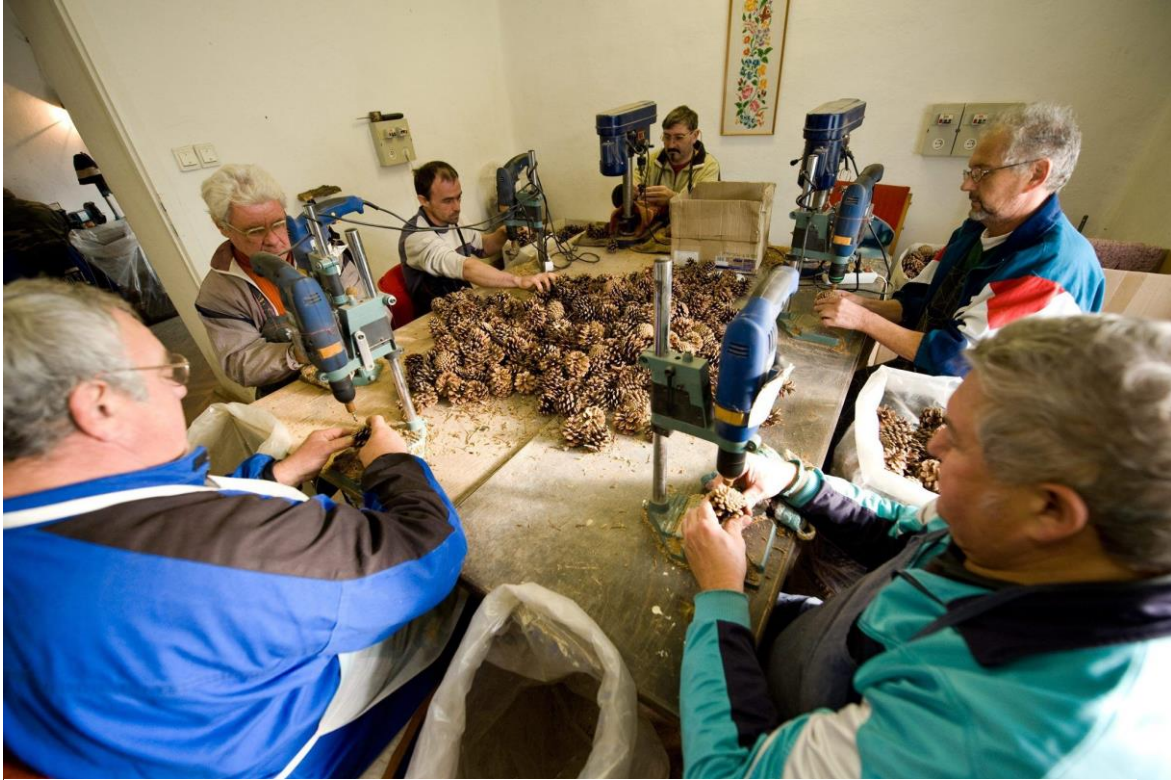
Szociális foglalkoztatottak dolgoznak egy csanádapácai üzemben. Többnyire csak a minimálisan fizethető összeget kapják.

Lesújtó képet fest az NRSZH jelentése a nappali ellátást nyújtó, illetve a bentlakásos szociális intézményekben folyó szociális foglalkoztatásról. A Magyar Nemzet által megismert, hatósági ellenőrzés tapasztalatait összefoglaló dokumentum szerint az intézményekben a legtöbb hiányosságot a betegeknek kifizetett munkabérekkel összefüggésben találták.