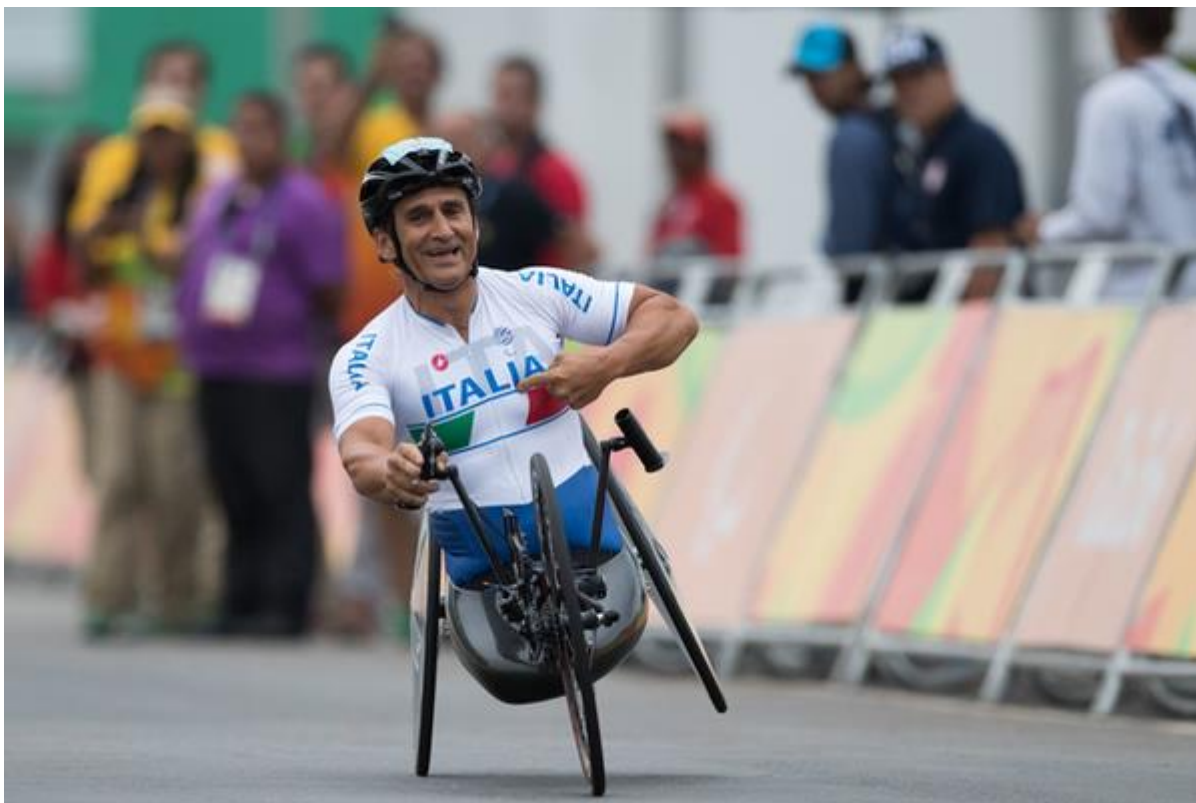
Alex Zanardi Rióban két aranyat és egy ezüstöt nyert

Nincs még egy sportesemény, ahol annyiféle sors találkozik, mint a fogyatékos sportolók legnagyobb seregszemlájén, és olyan sem, ahol ennyi tabutéma kerülne felszínre.