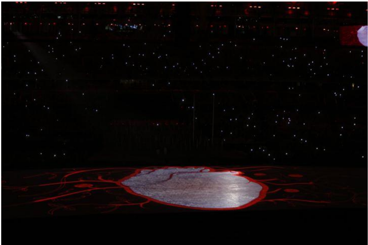
Az emberi szívet ábrázoló puzzle

Carlos Arthur Nuzman, a szervezőbizottság elnöke köszöntőjében úgy fogalmazott: az emberek különbözőképpen nézhetnek ki, de egyforma a szívük. „Az egyenlőség nevében vagyunk ma itt. Ti, sportolók inspiráltok bennünket a szenvedélyességetekkel. Szuper emberek vagytok, akik tudják, hogy nincs lehetetlen" – mondta beszédében, amelyben külön köszöntötte a paralimpián tevékenykedő önkénteseket.