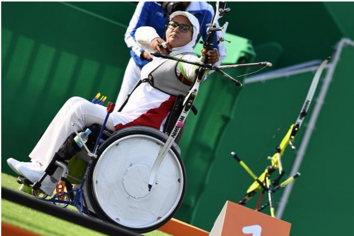
43 parasportoló képviseli a magyar színeket Rióban

A paralimpiába való befektetés a szociális érzékenység és a városi infrastruktúra fejlesztése révén járulhat hozzá a gazdasági életminőség javulásához – erről már György László, a Századvég Gazdaságkutató munkatársa beszélt. A szakember példaként említette, hogy minél többet költ az állam akadálymentesítésre, annak arányában nőnek a turisztikai bevételek. Londonban a paralimpia idejére például a buszmegállók 67 százalékát akadálymentesítették.