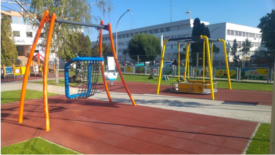
Galéria: Akadálymentes játszótér Nyíregyházán (10 kép)

Emlékeztek a MagikMe néven futó magyar találmányra ? Egy budapesti anyukának elege lett abból, hogy nem tud a három gyerekével játszóterezni, csak azért mert az egyikük, Jancsi súlyosan mozgáskorlátozott. Egy átlagos pesti játszótéren ugyanis nem nagyon van olyan játék, amelyen ott lehet hagyni egy Jancsihoz hasonló gyerkőcöt, hogy maga játsszon vele. Igazából egy nem átlagoson és egy nem pestin sem. Szóval leült pár barátjával és addig ötleteltek, míg meg nem találták a megoldást.