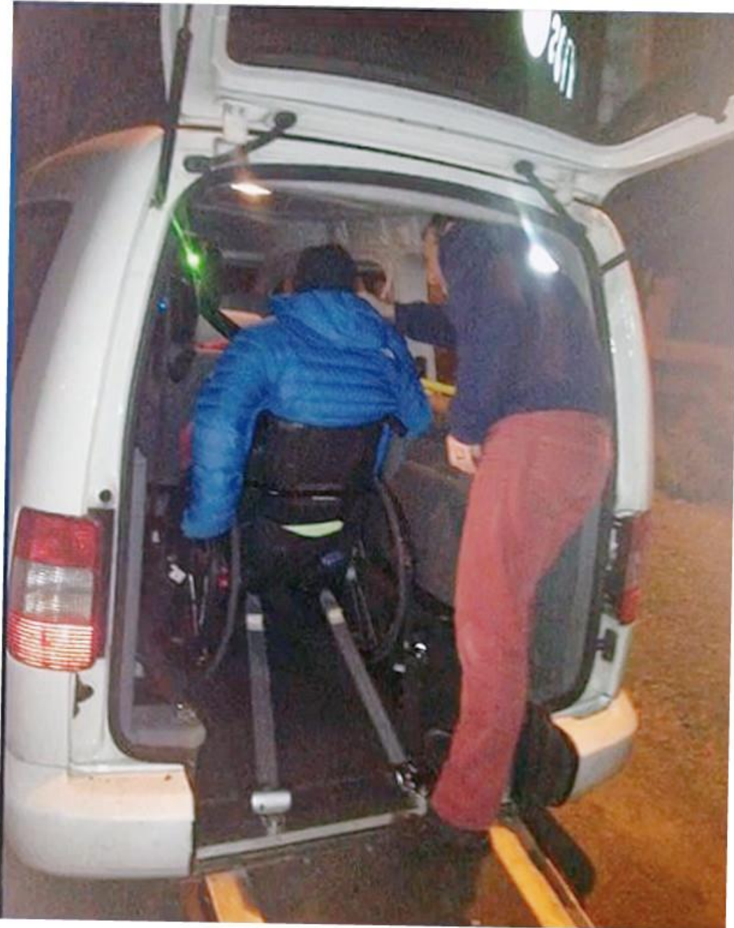
A VW Caddyt speciálisan alakították ki, egy rámpán a csomagtérből egyből a vezetőfülkébe jutni

Az autót egy csendes, XI. kerületi utcából vitték el a tolvajok a hajnali órákban. Az élet fintora, hogy a férfi végighallgatta, ahogy ellopják a különleges járművet.