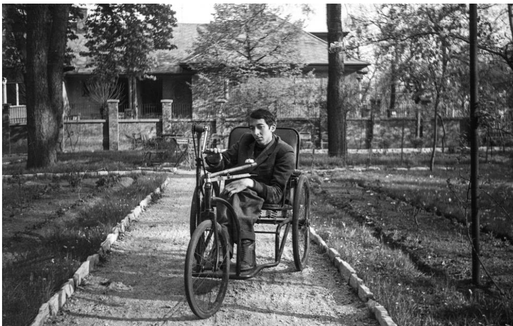
Fotó: a budapesti Május 1. úti Mozgássérültek Állami Intézetének egyik lakója az 1960-as években.

Amikor valamilyen személyes szolgáltatást nyújtunk, mindig kérdés, hogy hogyan vizsgáljuk annak a minőségét. Ez szociális területen is így van. Ennek egyik mérési lehetősége az, amikor a szolgáltatás jellemzői alapján határozzuk meg a minőséget, pl. a szakképzett dolgozók száma, az egy főre jutó négyzetméter, hányan használnak egy fürdőszobát stb. A másik lehetőség, hogy a szolgáltatást igénybe vevő fogyatékos emberek életminőségét próbáljuk mérni. Ez már bevett gyakorlat külföldön és komoly módszertana van. Ebbe természetesen beletartoznak az objektív szempontok is, mint az előbb említett fürdőszoba, de annál jóval tágabb, benne vannak az egyén társas kapcsolatai, az emberi méltóság tiszteletben tartása stb. Figyelembe veszi azt is, hogy az egyén mennyire elégedett azzal, ami körülveszi. Viszont önmagában ez az elégedettség nem jó mutatója a szolgáltatások által nyújtott életminőségnek, mert az sok minden mástól is függ. Például a teljes társadalmat nézve az OECD egyik vizsgálata (Better Life Index) azt mutatta, hogy Magyarországon sok objektív mutatónk közepes, de a szubjektív elégedettség mégis a legalacsonyabbak között van.