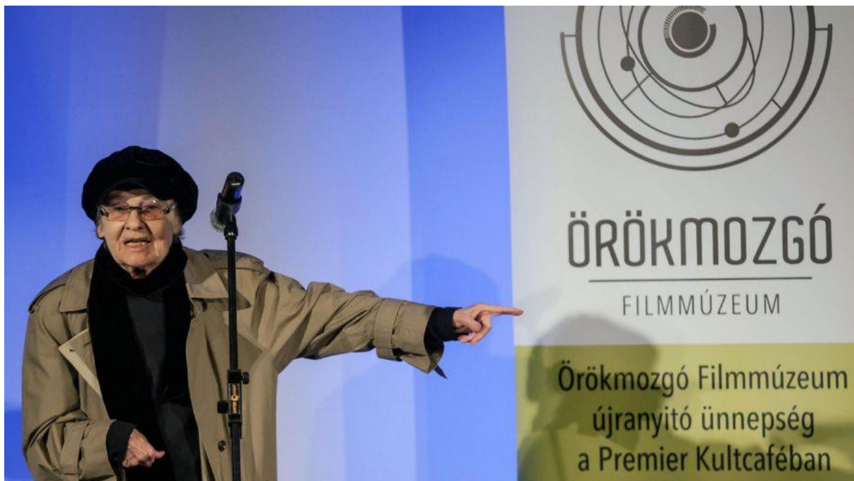
Töröcsik Mari

Visszatérve hagyományaihoz, havi program szerint működik a filmmúzeum. Töröcsik indította útjára.