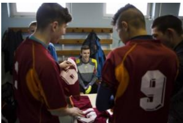
Befogadták a társak

Természetesen, ahogy az a gyerekek között megesik, eleinte gúnyolódtak a testi fogyatékoságán, azt érzi pályafutása eddigi legnehezebb időszakának. „De amikor összebarátkoztunk, már nem volt probléma. Az ellenfeleim is ismernek, így ritkábban fordulnak elő megjegyzések, de azért akadnak durva beszólások. Érdekes, ha már gólokkal vezetünk, nagyon jól viselem. Ha hátrányban vagyunk, akkor kevésbé...”