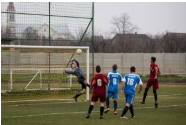
Jók a reflexei

Ez önmagában is becsülendő teljesítmény.