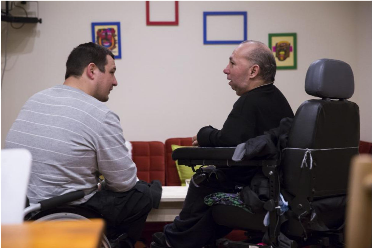
A kávézó akadálymentesített

emberek félnek az ismeretlentől, idegenkednek attól, hogy sérülteket alkalmazzanak, pedig csak egy kicsit kéne a komfortzónájukon túllépniük. Ez a hely ezekre a dolgokra is frappáns válasz lehet, ha bejön.