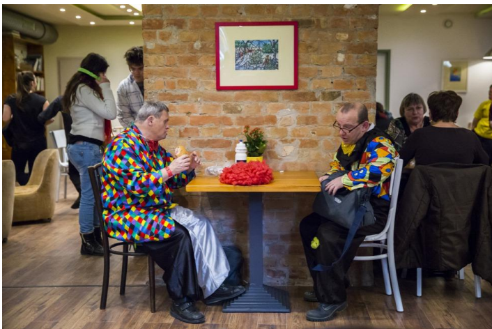
A színjátszó kör tagjai átjöttek uzsonnázni