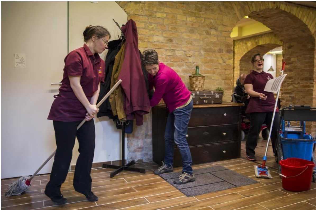
Boszorkányos ügyesség

Összesen 24 sérült ember és két olyan dolgozik a kávézóban, akiknek nem változott meg a munkaképessége. Egy-egy műszak 4–6 órás, a terhelhetőségtől függően, a fizetés a közalkalmazotti bértábla szerint megy: a minimálbér részarányos összege. Három castington választották ki őket 90 jelentkezőből, még tavaly ősszel. A felkészülés rengeteg szituációs gyakorlatból állt, azt is elpróbálták, mi van akkor, ha mondjuk a kedves vendég illuminált, erőszakos, vagy mondjuk megjegyzést tesz a felszolgáló kerekesszékeire. Persze volt, aki az elején egy ilyen szituációban azonnal lefagyott, de aztán szépen begyakorolta magát. És hát bármi adódik, az alapszabály az, hogy szólni kell a műszakvezetőnek.