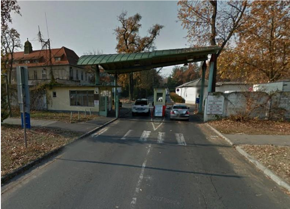
Itt történnek ám a csudálatos dolgok

Január 2-án be kellett vinnünk az édesanyámat a Debreceni Klinika Bőrgyógyászati osztályára, mivel a hatalmas lábszárfekélye begyulladt – 4 éve ott kezelik. A kötelező vizsgálatokat elvégezése után édesanyámat felvették osztályra, amit a felvételi lap igazol. Ezzel semmi baj sincs. A gond ott kezdődött, amikor el akartuk hagyni a Klinika területét. A sorompónál a biztonsági őr diszpécserre közölte, hogy mivel nincs ott az édesanyám (akié a rokkantkártya), 1 600 forintot ki kell fizetnünk. Kérdeztem tőle, hogy miért, hiszen mi szállítottuk be a Bőrklínikára, ahova be is fektették. Közöltem, hogy kifizetem az 1 600 forintot, viszont kérek egy jegyzőkönyvet arról, hogy milyen szabályt sértettünk.