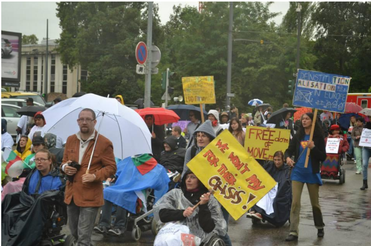
Bolgar tüntetők Brüsszelben: Ne mi fizessünk a ti válságotokért!

Magyarországon is volt kísérlet utcai tiltakozásra: a Mozgássérültek Egyesületeinek Országos Szövetsége 2012-ben a Hősök terén tiltakozott „A fogyatékos emberek nem csalók!” címmel a sokak által kritizált rokkantsági felülvizsgálatok ellen. Idén áprilisban ismét több százan vonultak a Parlament elé, a fogyatékos embereket támogató civil szervezetek nevében, az elvonások ellen tiltakozva.