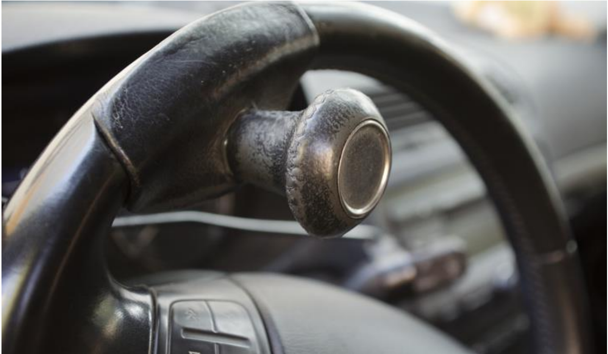
Kormány forgatógomb az egykezes vezetéshez

Laciban máig erősen él az egészségügyi alkalmassági vizsga emléke. Ez ugye mindenki számára kötelező a jogosítványszerzés előtt, de a szokásos látás- és egyéb alkalmassági feladatok mellé egy mozgáskorlátozott esetében más is jár: egy komplex orvosszakértői vizsgálat, ahol pedálokat kell nyomogatni, és különféle tesztekkel igazolni, hogy képes akkora erő kifejtésére és olyan koordinációra, ami a vezetéshez kell. Keze és lába miatt rengeteg vizsgálaton járt már, nem vonja kétségbe, hogy ezeknek van értelme, de kevés megalázóbb emléke van annál, mint amikor az orvosok E/3-ban passzolgatták egymásnak a témát, mit engedjenek neki ilyen kézzel és lábbal.