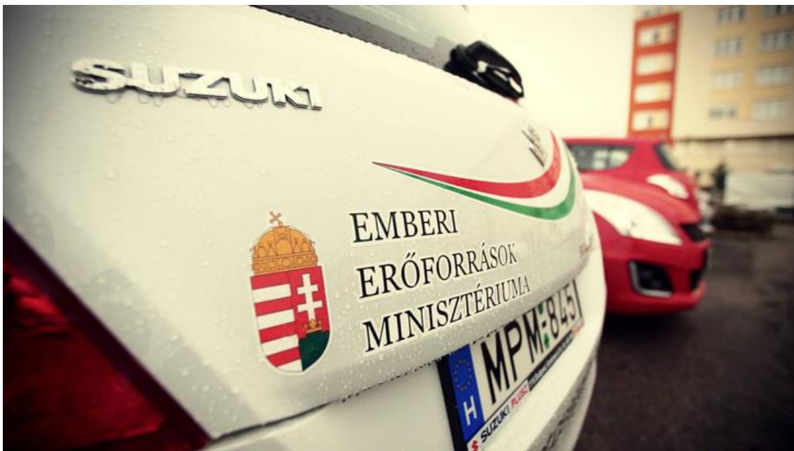
Felmatricázott Swift a Lehetőségautó Kft. telephelyén