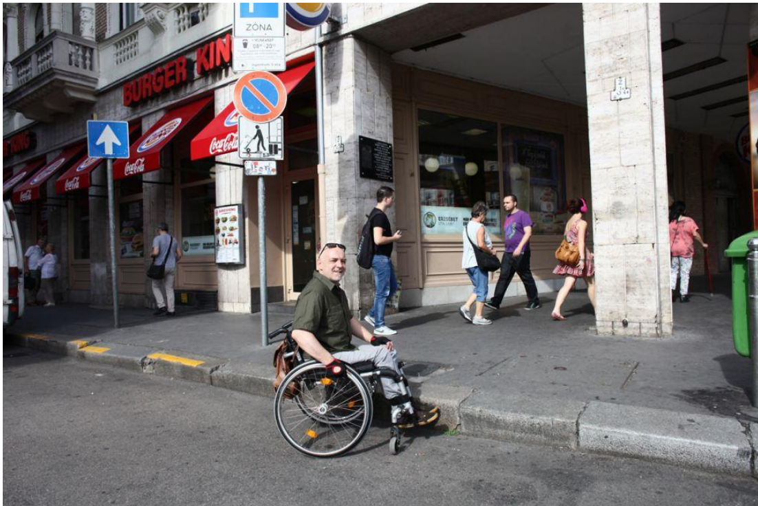
Lassan a Blahára érünk, a metróba lejutni esélytelen.