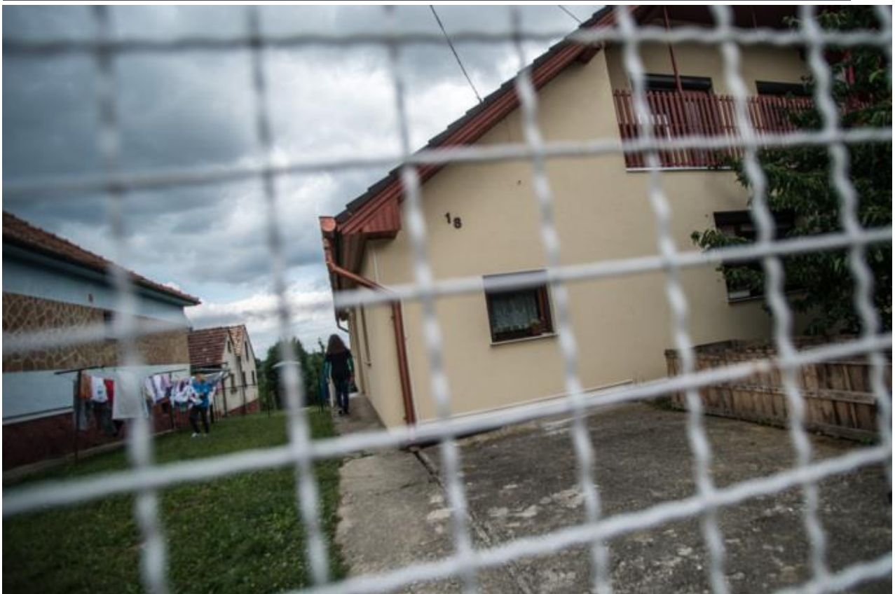
1999. év nyarán a KézenFogva Alapítvány és a holland nagykövetség vásárolta meg a sokszobás családi házat és a hozzá tartozó hatalmas telket