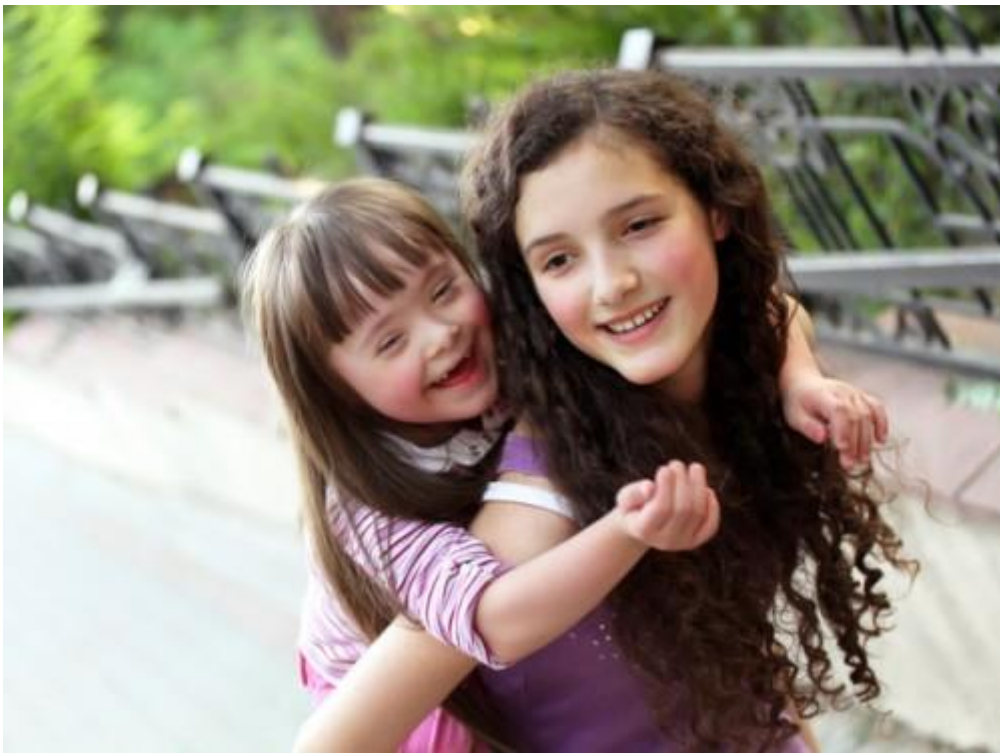
"Egy egész életen át tanítanak ezek a gyerekek."