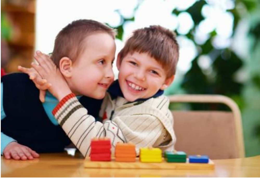
"Egy fogyatékos testvér mellett felnőni nagyon különleges élmény."