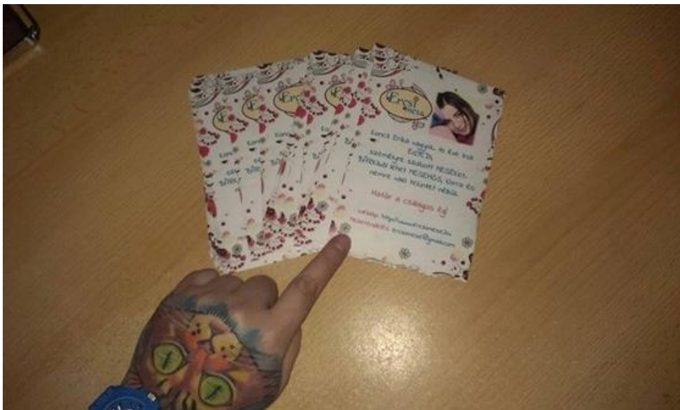
szórólap a mesékhez

„Egy rövid jellemzés és egy fénykép alapján bárkiről tudok mesét írni. Különleges meséket, ugyanis nincsenek benne negatív hősök, nincsenek benne gonoszak. Úgy gondolom, hogy elég sok rossz dolog van a világban, legalább a mesék legyenek jók. Egyébként én nagyon szeretem ezt az egész meseírósdit. Nagyon tetszik, hogy ezt csinálhatom. Én ezért odavagyok.” Az emberek meg a meséiért. Van olyan gyerek, aki a történeteinek keresztül értette meg, mit jelent az, hogy ételallergiája van, egy másik azóta nem fél a hajszárítótól, amióta egy mese megvilágította, miért nem kell.