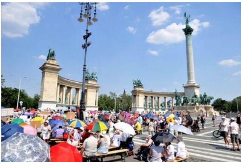
Résztevők a rokkantak, fogyatékkal élők, az idősek és az elesettek jogaiért tartott demonstráción a fővárosi Hősök terén.

A fenti intézkedések miatt súlyos egészségkárosodott emberek tízezeinek csökken és szűnik meg az ellátása, miközben a munkaerőpiacon nincsen számukra hely. A lépések már eddig is több emberi tragédiához vezettek: volt, aki öngyilkos lett, és volt, aki a rehabilitációra alkalmasnak minősítése után belehalt az évek óta tartó súlyos betegségébe.