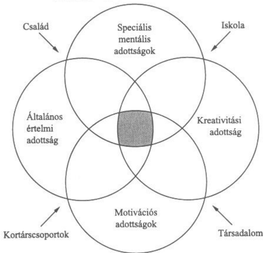
Ábra. A 2 × 4 faktoros talentum-modell.

A környezeti hatások közül a gyermek kibontakozása elsősorban a neveltetéstől ( család ) és az oktatástól ( iskola ) függ. Mindkettő egyfajta tehetséggondozó műhelyként is funkcionálhat, de csak abban az esetben, ha a szülők, illetve felkészült pedagógusok alkotják ezt a műhelyt. A családi hatások között megjelenhet olyan kulturális háttér is, mint a vallás. A gátló tényezőket is meg kell említenünk, mint például a gyermekbe oltott túlzott becsvágy, a rideg szülő-gyermek kapcsolat, az apa és az anya eltérő értékrendje, amelyek negatívan befolyásolhatják az egyén szellemi fejlődését.