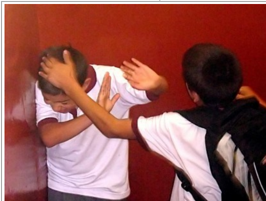
Nem csak ilyen agresszió létezik

A pszichológia a hasonló megnyilvánulásokat mikroagresszióknak hívja; ezeket először az etnikai kisebbségekkel kapcsolatban írták le, de a koncepciót később minden kisebbségi csoportra kiterjesztették. A mikroagressziók épp azért különösen károsak, mert apróságoknak tűnnek; aki elköveti őket, gyakran nem is érzi a jelentőségüket. (Magyarul a kérdéskörnek gyakorlatilag nincsen irodalma, az interneten néhány érintőleges említést és egy rövid ismertetőt találtunk csak.)