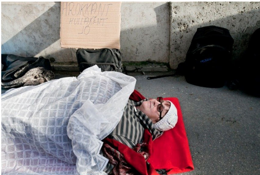
Egy fekvő demonstráló rokkant a mozgássérültek december 3-i tüntetésén Budapesten

Szabó Máté, az alapvető jogok biztosa júliusban beadványban sérelmezte a rokkantsági ellátásra vonatkozó törvény bizonyos rendelkezéseit, és kérte az Alkotmánybíróság utólagos normakontrollját. A testület eddig kétszer vette napirendjére a kérdést, harmadszorra december 4-én tárgyalnak a kifogásokról. Ezek egyike az, hogy lehessen a rehabilitációs ellátás mellett is dolgozni, illetve, hogy töröljék el azt a jövedelemkorlátot, amely a súlyosabb rokkantaknál van érvényben. E szerint az, aki rokkantsági ellátásban részesül, bár dolgozhat mellette, nem kereshet többet a minimálbér másfélszeresénél, 139 500 forintnál. Az ombudsman szerint ezek, és még egy sor szigorítás, sérti a korábbi rokkantnyugdíjasok esélyegyenlőségét és az emberi méltósághoz való jogot is, de azért is az alkotmányba ütközhet, mert nem adott kellő időt a felkészülésre, átmenetre.